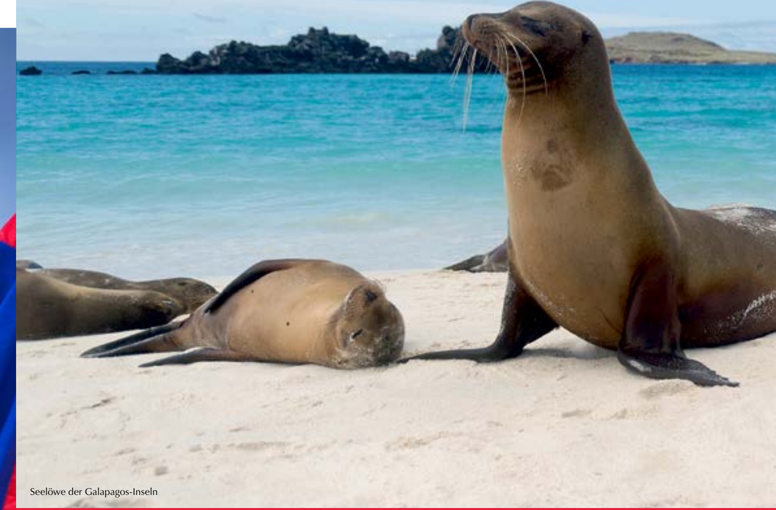
Seelöwe der Galapagos-Inseln

Faszination, Leidenschaft, Begeisterung, die Wunder der Natur genießen, unvergessliche Orte als Pionier entdecken, aktiv zu Fuß, per Rad oder auf dem Wasser, interessanten Menschen und Kulturen begegnen, eintauchen in die Seele eines Landes, über alte Traditionen staunen und sich von neuen Horizonten inspirieren lassen